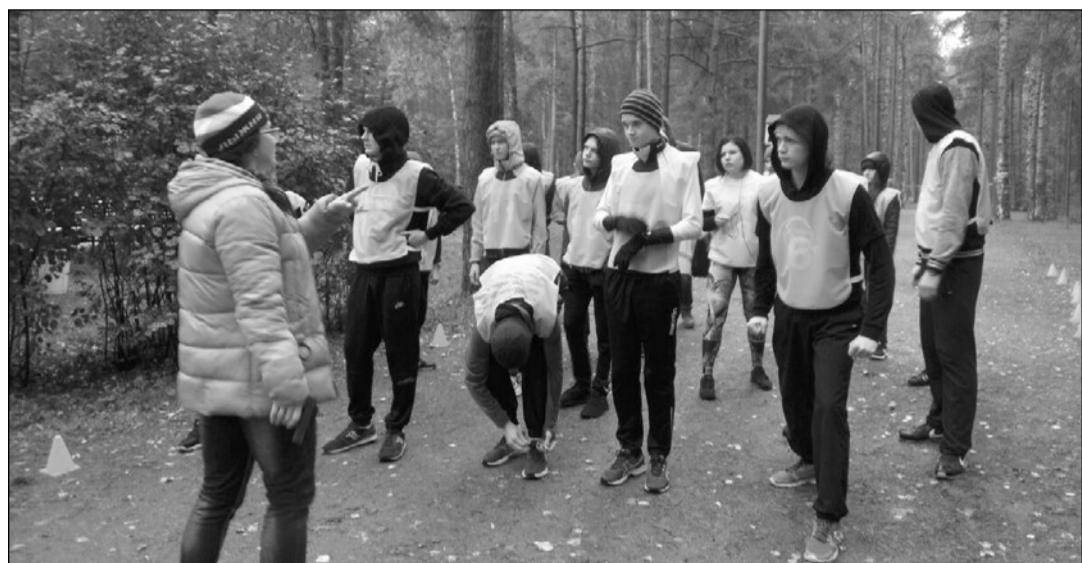
Команда ПМЦ «Снайпер» приняла участие в спартакиаде подростково-молодежных клубов Санкт-Петербурга.