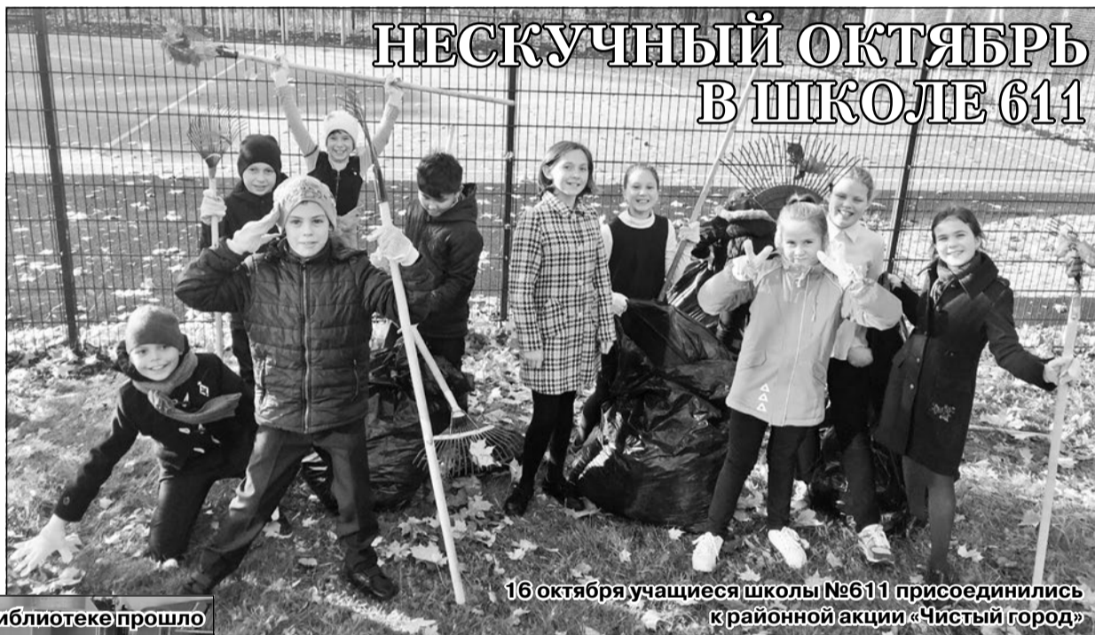
16 октября учащиеся школы №611 присоединились к районной акции «Чистый город»