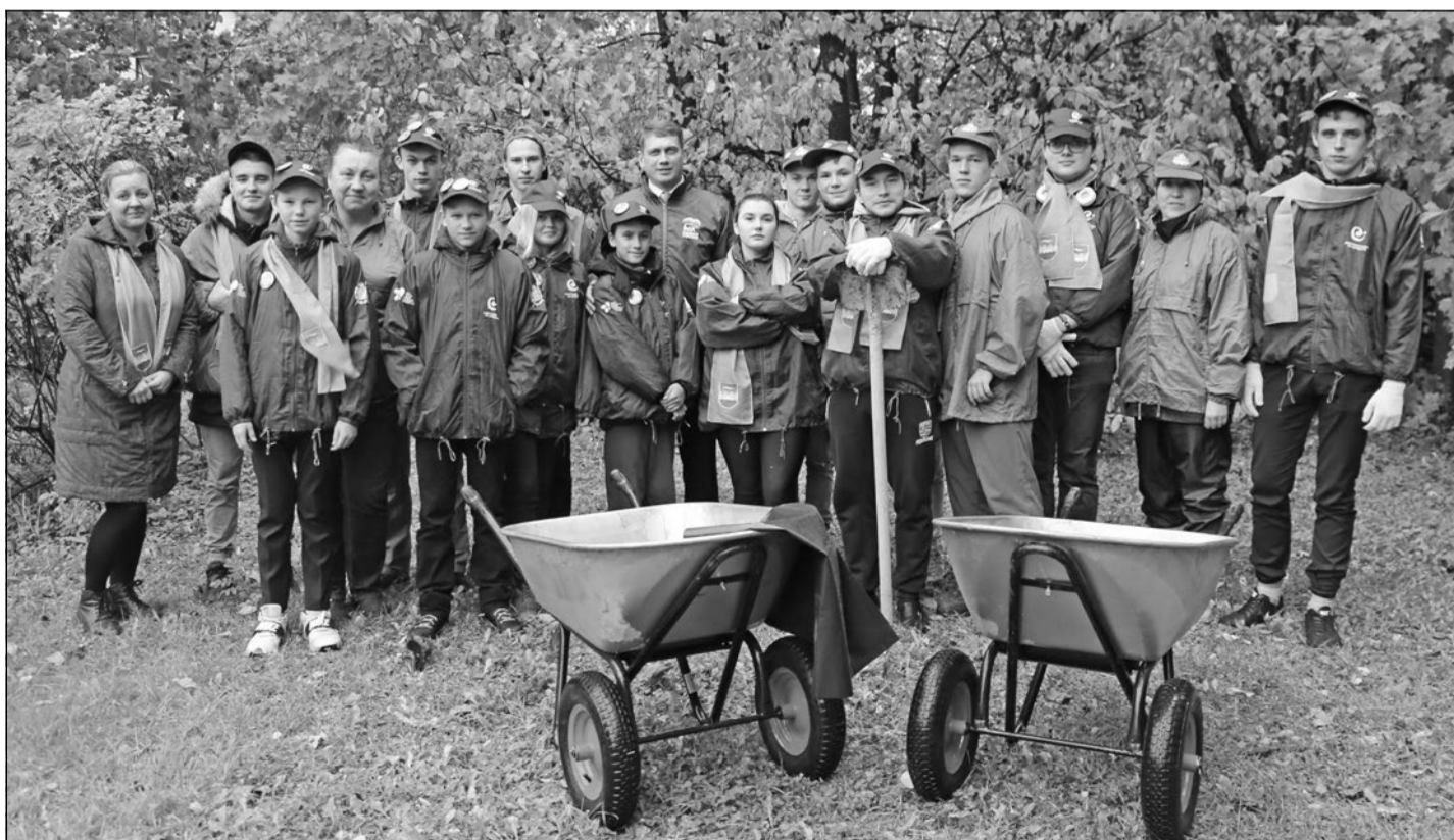
5 октября Добровольцы ПМЦ «Снайпер» и Молодежный совет Зеленогорска провели совместную городскую акцию «Чистый ручей – чистый залив».

1 октября в ПМЦ «Снайпер» прошла акция «Молодым везде у нас дорога, пожилым везде у нас почёт!», приуроченная ко Дню пожилого человека! В ходе акции были собраны и переданы подарки для пожилых людей, находящихся в доме престарелых нашего района. Участники акции собирали теплые носки, рукавицы вязаные шапки и шарфы, а также канцелярские принадлежности – блокноты, ручки, карандаши и, конечно же, книги. Организаторы выражают огромную благодарность всем, кто остался неравнодушен и принял участие в акции!