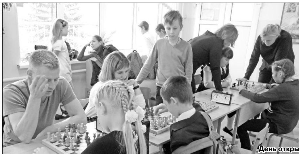
День открытых дверей