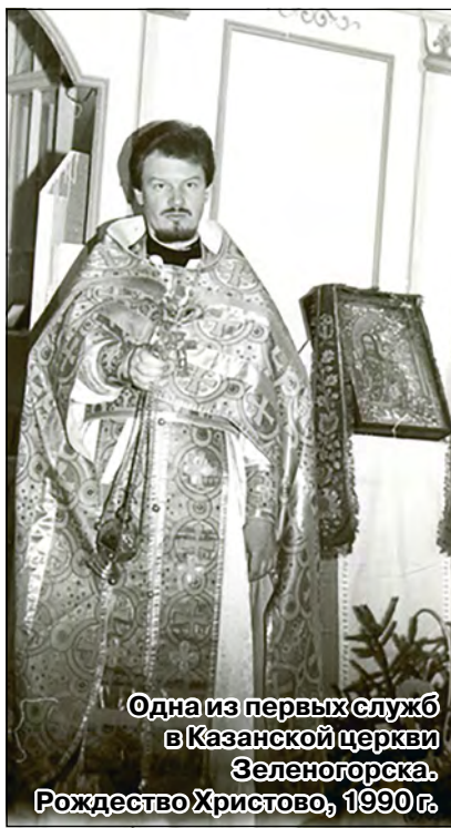
Одна из первых служб в Казанской церкви Зеленогорска. Рождество Христово, 1990 г.