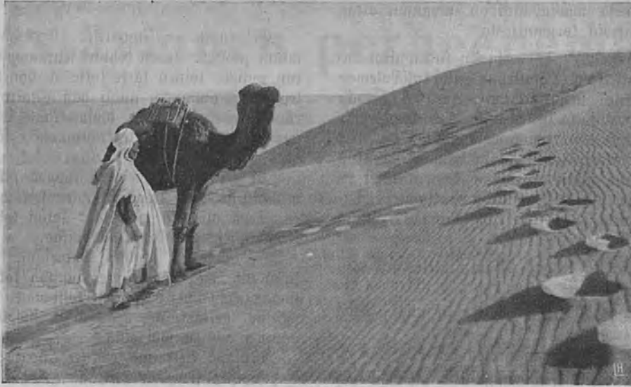
Kuva Tripoliksestä: Erämaanmaisema sisämaassa.

siitä, asettuvatko maan varsinaiset asujamet, puolivillit berberiläiset, eteläpuolisissa luoksepääsemättömissä vuorilaaksoissaan uusia valloittajia vastustamaan, mutta se turkkilaisten tähänastisen huonon hallinnon takia tuskin on luultavaa; Europan valtojen äänettömän suostumus Italiassa jo on.