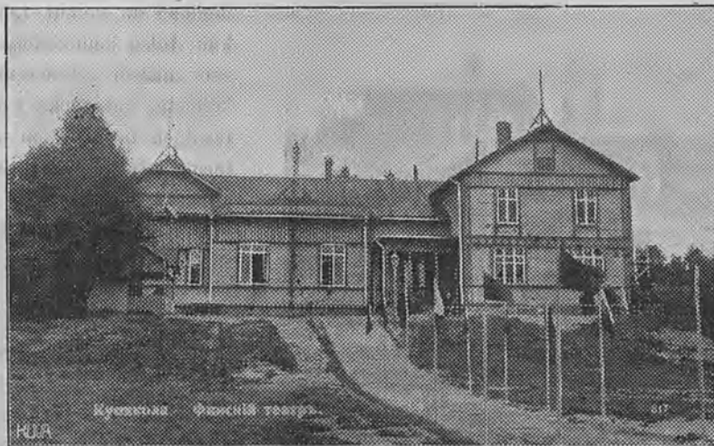
Kuokkalan nuorisoseuran talo.